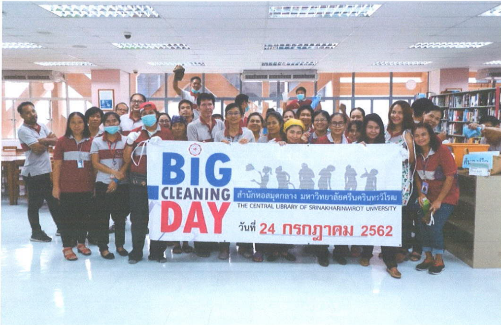
ห้องสมุดองค์กรักษ์