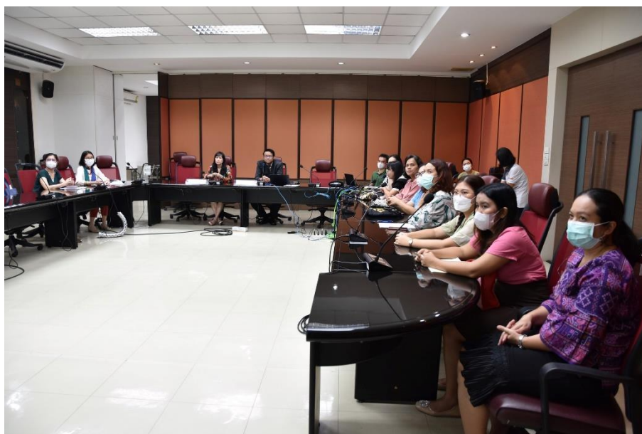
คณะกรรมการทันตแพทยศาสตร์ วันที่ 13 ธันวาคม 2566