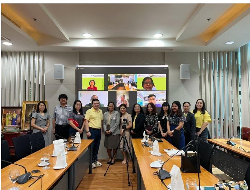
คณะสังคมศาสตร์ วันที่ 13 พฤศจิกายน 2566