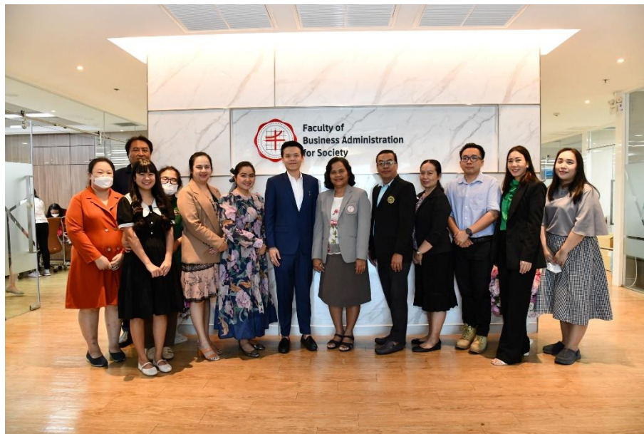
คณะบริหารธุรกิจเพื่อสังคม 21 ธันวาคม 2566