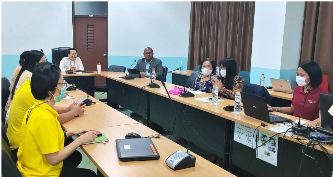
คณะกายภาพบำบัด 13 พฤศจิกายน 2566