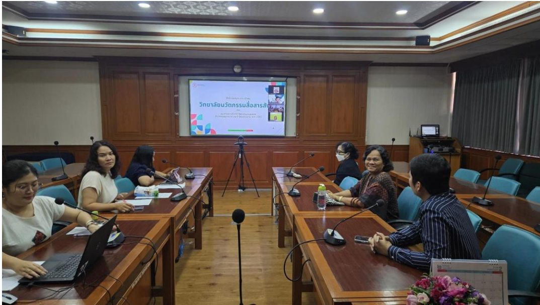
วิทยาลัยนวัตกรรมสื่อสารสังคม วันที่ 13 มีนาคม 2567