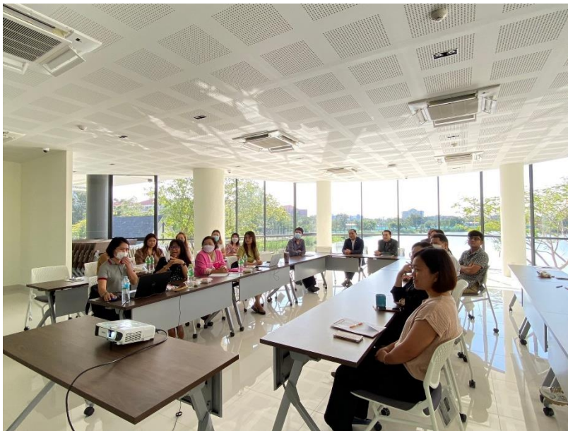
วิทยาลัยโพธิวิชชาลัย 7 พฤศจิกายน 2566