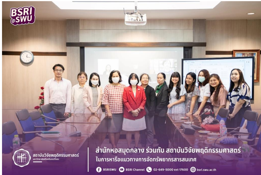
สถาบันวิจัยพฤติกรรมศาสตร์ วันที่ 4 มกราคม 2567