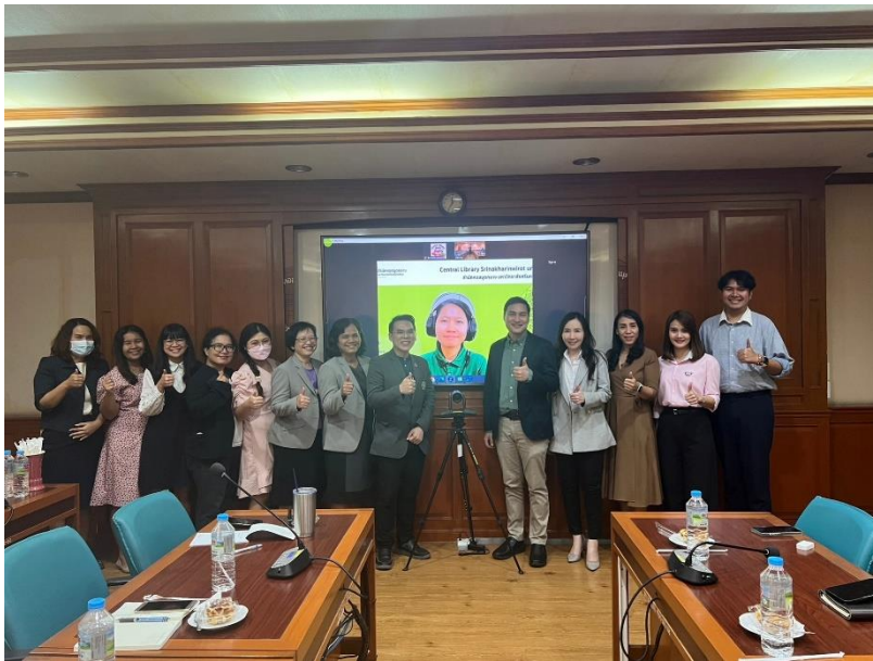
สำนักนวัตกรรมการเรียนรู้ วันที่ 23 มกราคม 2567